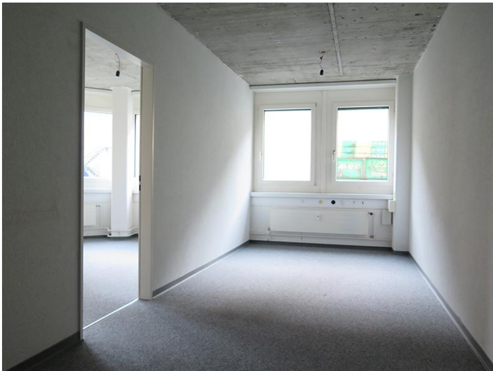
Gang mit Eckbüro links