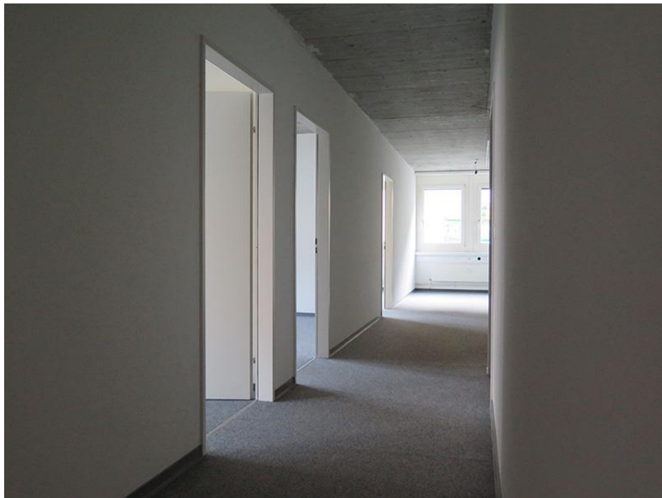
Blick vom Eingangsbereich, links Büros, rechts Lagerraum