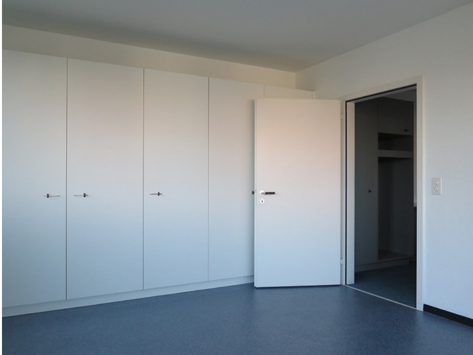
Büro mit Einbauschränken