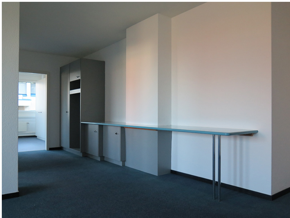
Eingangsbereich mit Ablage, Schränken und Garderobe

Die Trennwand zur Mietfläche 1301 kann entfernt werden, so dass die Mietflächen 1301 und 1302 zusammen eine Bürofläche von 294 m 2 ergeben.