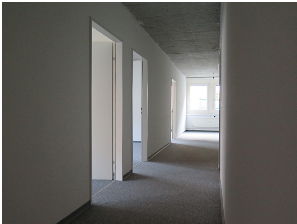
Blick vom Eingangsbereich, links Büros, rechts Lagerraum

Die Trennwand zur Mietfläche 1302 kann entfernt werden, so dass die Mietflächen 1301 und 1302 zusammen eine Bürofläche von 294 m 2 ergeben.