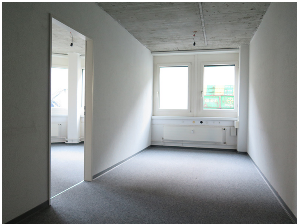
Gang mit Eckbüro links